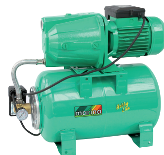
CAM 100/25 HL

P1 800 watt Q max. 50 l/min 1,4 ÷ 2,8 bar