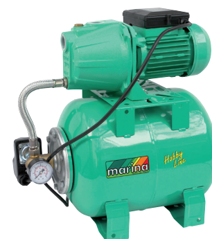
CAM 40/22 HL

P1 800 watt Q max. 50 l/min 1,4 ÷ 2,8 bar